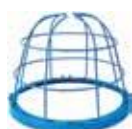
Ochranný koš ocelový 1-99.6231