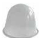
Ochranný skleněný kryt 232.5068/1