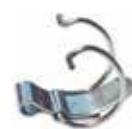
Nerezový uzávěr 4-99.6180