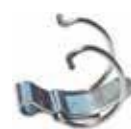
Kovový uzávěr 4-99.8470